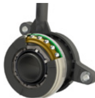
Выжимная муфта сцепления