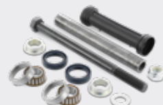
KIT BRACCI SOSPENSIONE KS 5

Scegliere l'offerta SNR è scegliere qualità e massime prestazioni.