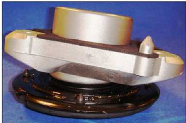
Внешний вид окончательной сборки