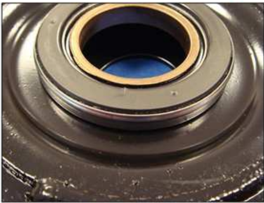
Правильная установка опоры стойки

Соблюдайте направление установки подшипника опоры: металлическая сторона не должна быть видна