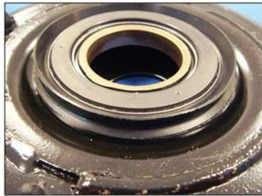
Установка уплотнения на опору

Соблюдайте направление установки уплотнения: уплотнительная кромка должна быть направлена к резиновой опоре.