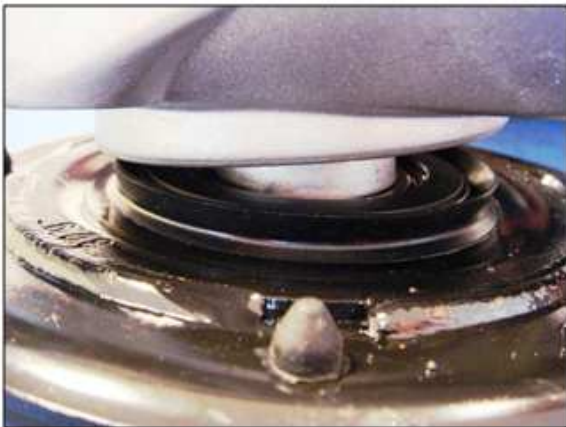
Установка блока фильтра в держателе

Соблюдайте направление установки уплотнения: уплотнительная кромка должна быть направлена к резиновой опоре.