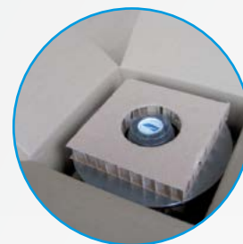
Polsterung der Bremsscheibe inklusive Radlager