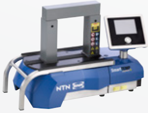
SmartTEMP S Maks. 50 kg

Rulmanları ve dişlileri güvenle ısıtmak için ideal cihaz