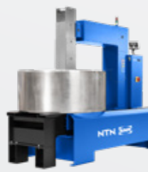
SmartTEMP XXXL Maks. 1600 kg

Örnek referans: TOOL SMART TEMP L / induction heater