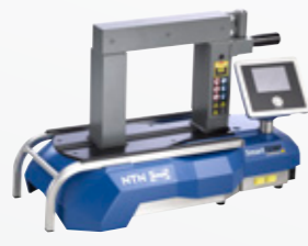
SmartTEMP M Maks. 100 kg