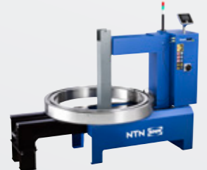
SmartTEMP XXL Maks. 800 kg