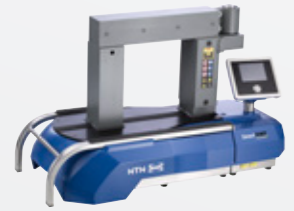
SmartTEMP L Maks. 200 kg