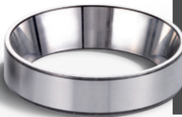
Pista superfinita effetto a specchio