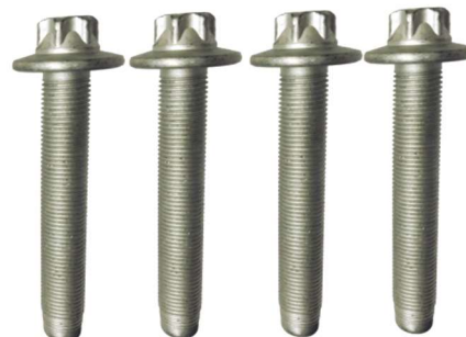
R159.65: Citroën C4 Picasso II