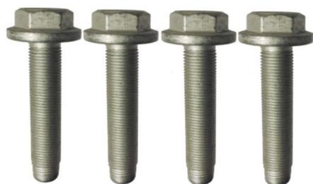
R159.64: Peugeot 308 II