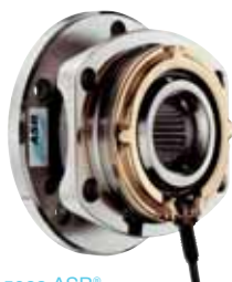
Подшипник колеса ASB® с датчиком и его держателем.