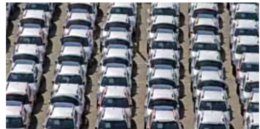
Группа NTN-SNR – поставщик крупнейших производителей автомобилей.

« Технология ASB®, ставшая отныне стандартом мехатронных подшипников, символизирует нашу увлеченность делом. Подобные технологии придают подшипникам особую ценность, способствуют усовершенствованию автомобилей. Однако, ассортимент деталей NTN-SNR, предназначенных для сборки автомобилей, не ограничивается подшипниками для колес. Он представлен широким диапазоном изделий: