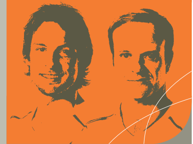
Дженсон Баттон, Рубенс Барикелло