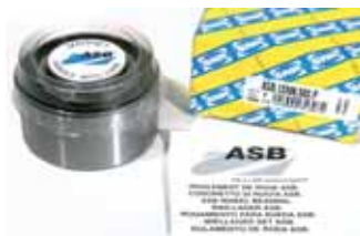
Подшипник ASB® с техническим описанием и с защитной крышкой.