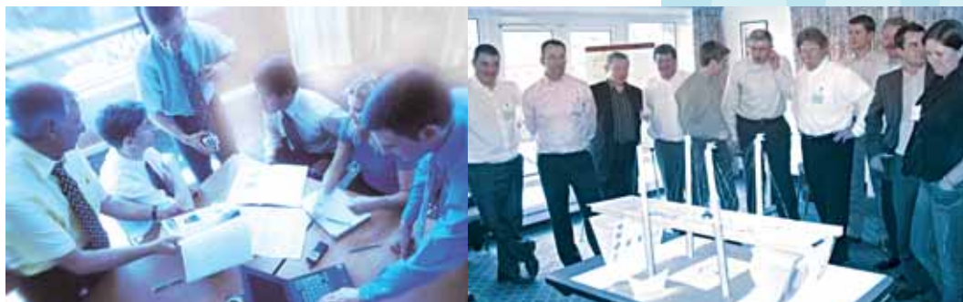
Тренинг по развитию командного взаимодействия между коллективами NTN и SNR.