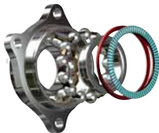
Внутреннее устройство подшипника ASB®.