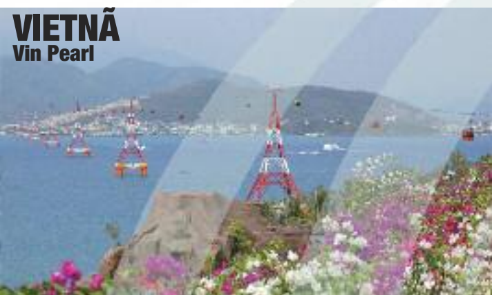
VIETNÃ Vin Pearl