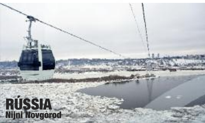
RÚSSIA Nijni Novgorod