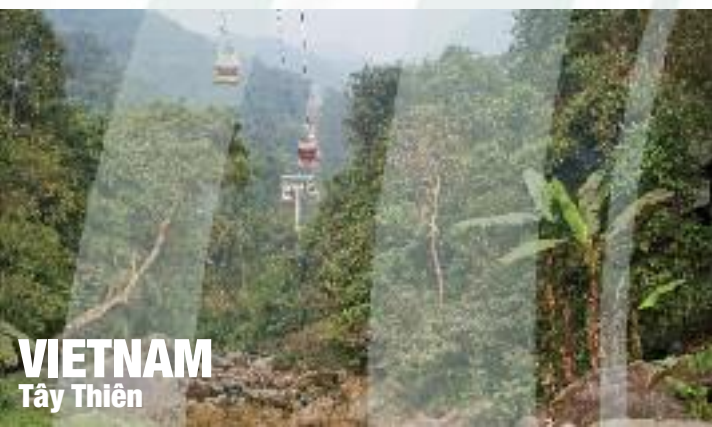
VIETNAM Tây Thiên