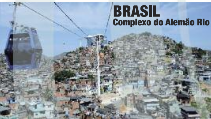
BRASIL Complexo do Alemão Rio