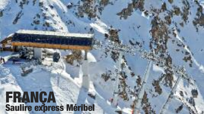
FRANÇA Saulire express Méribel