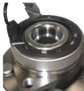
Obj. č. OE 96812619 R190.23