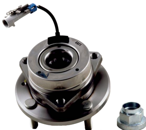
Obj. č. OE 96639585 R190.06

Na určenie ložiska, ktoré má byť montované na vozidle, sa musí vykonať vizuálna kontrola: ložisko s kovovým krytom zodpovedá súprave R190.06.